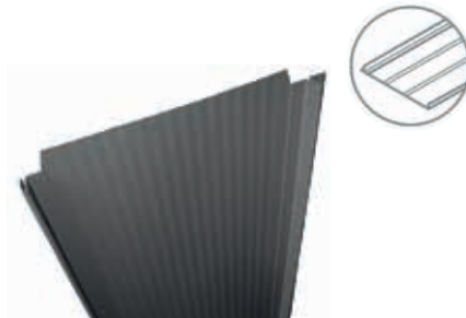
COMAX KLIK 31

Tato krytina svým vzhledem připomíná klasický falcovaný plech na dvojité stojaté drážce. Dokonale provedená dutá drážka je funkčním a současně estetickým prvkem jak na střechách, tak na fasádách. Funkce zaklapnutí duté drážky eliminuje nutnost odborné montáže, a to zejména na méně členitých střechách (pultové střechy, garáže, pergoly a přístřešky). COMAX KLIK 31 se vyrábí z kvalitní slitiny hliníku nebo jsou surovinou ocelové plechy.